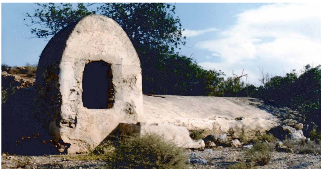
Aljibe del Cjo del Tollo, supone la adaptación de un modelo sencillo y eficaz

Documentos antiguos 3 señalan la obligación del concejo de Dalías en su abasto, mantenimiento y limpieza, una carga gravosa 4 de la que sólo se vio libre con la crisis de la ganadería tradicional y la venta de los propios a lo largo del siglo XIX. Se trata, por tanto, de bienes públicos, que nunca debieron de ser enajenados ni privatizados.