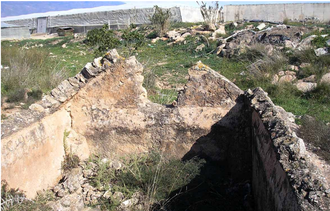
Aljibe de El Toril, con su bóveda hundida de antiguo

Hay que distinguir estos aljibes ganaderos de otros semejantes en tipología, aunque sin escaleras de acceso interior, adscritos al almacenaje de agua de riego o al consumo público de pequeños núcleos de población, o de aquellos que formaban parte de fortalezas o del abastecimiento a las ciudades, generalmente más complejos en estructura.