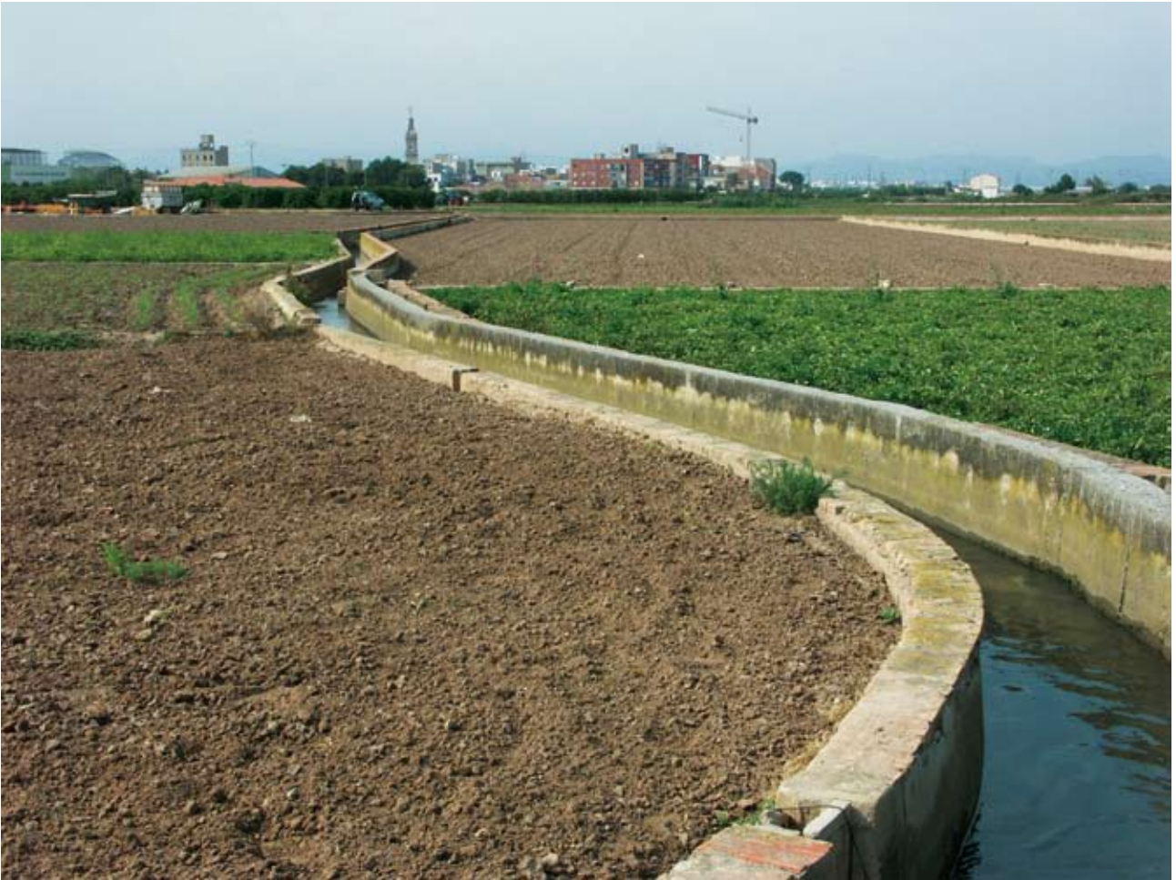
El braç de Dalt del brazo de Petra de la acequia de Mestalla y, al fondo, Carpesa. Se constata la adaptación del trazado a las curvas de nivel, en un ámbito que, además, fue marjal al menos hasta el siglo XIII

conjunto de brazos, files, rolls y regadoras que toman el agua de la acequia madre y la distribuyen por las parcelas para su uso. No todos son iguales en jerarquía y funciones y hay que establecer una clara diferencia entre ellos: los brazos representan las grandes particiones del sistema mientras que las filas y rolls suelen corresponder a tomas de menor entidad, mientras que las regadoras son los canales más sencillos que llevan el agua a cada parcela.