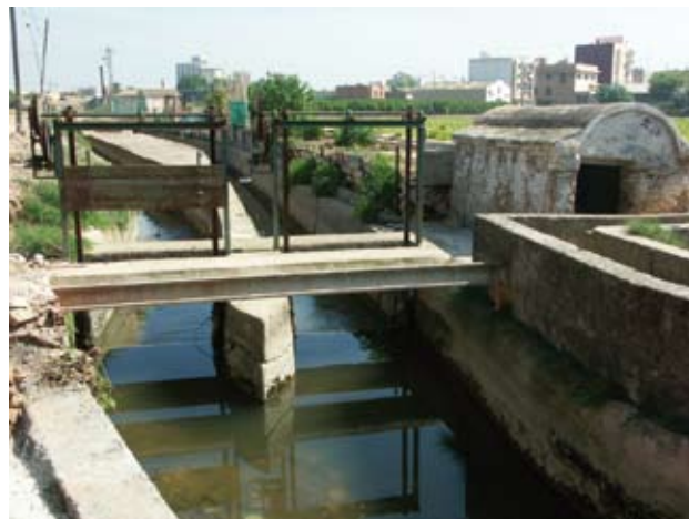
Llengües d’Alboraia-Almàssera de la acequia de Rascanya, en el límite del término municipal de Valencia, a la izquierda, con el de Tavernes Blanques, a la derecha de la imagen. Estos partidores eran los que, en el diseño del sistema hidráulico, permitían dotar siempre de agua proporcional a las dos alquerías-pueblos medievales: el brazo de Almàssera por la izquierda en dirección a esta localidad tras cruzar el barranco del Carraixet, y el brazo de la Riquera por la derecha, que era el propio de Alboraia

Por su parte, la mitad sur de la huerta y con punto inicial en su casco viejo presenta una imagen bastante parecida a la anterior pero quizá con dos ejes fundamentales en vez de uno. Se trata del camí reial de Xàtiva , también llamado desde hace siglos camí de Sant Vicent (de la Roqueta) y en épocas más modernas y en su trazado pasado este convento, carretera real de Madrid. El otro camino-eje viario vertebrador es el camí de Quart o Quart-extramurs, convertido a partir de Mislata en camí de Castella en las épocas más antiguas y también en carretera real de Madrid en las más recientes. Entre ellos se pueden enumerar otra serie de caminos históricos que también presentaban esa forma radial y quer serían el camí de Torrent , el camí vell de Picassent , el camí de Malilla , el camí de Russafa y el camí de Montolivet .