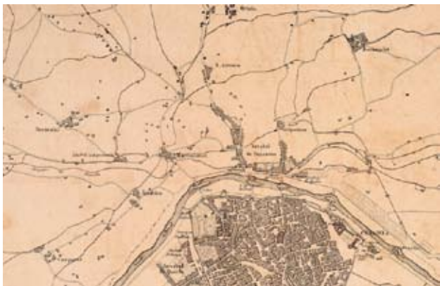
Elementos definidores del paisaje de la Huerta de Valencia: acequias, caminos, pueblos y alquerías, en uno de los planos de Valencia de las Guerras Napoleónicas

cambios históricos a lo largo de los siglos los cultivos mayoritarios han ido cambiando de forma notable, alterando no sólo la estricta producción agrícola sino también el mismo paisaje o “sky line” de Valencia y su huerta. Así, durante la época bajo-medieval la Huerta de Valencia se caracterizó por el cultivo de cereales panificables, fundamentalmente trigo y centeno, y de la viña, mientras que las hortalizas y frutales ocupaban parcelas reducidas o los márgenes de los campos y acequias en el segundo de los casos. La razón fundamental es que los alimentos básicos de la sociedad y mentalidad feudal medieval eran los típicos de la trilogía mediterránea –pan, vino y aceite–, pero sin olvidar que ni los medios de transporte ni los mercados de la época permitían una producción comercializable importante de elementos perecederos.