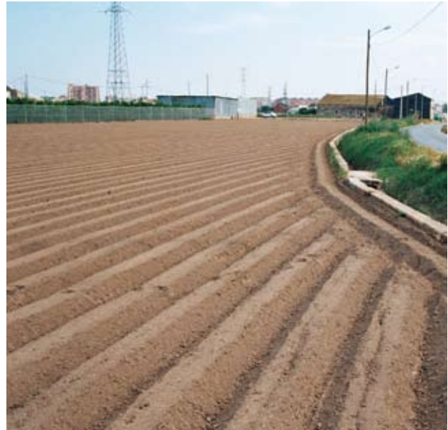
Adaptación de la parcela medida en hanegadas a la curva del camino de Carpesa, generando un límite exterior claramente irregular que dificulta la medición del campo. Razonablemente el camino era previo al repartimiento y medición feudal del siglo XIII y fue respetado como eje organizativo del paisaje

Es por ello que el asentamiento poblacional musulmán alrededor de la ciudad a partir del siglo VIII y su crecimiento progresivo hasta principios del siglo XIII estuvo íntimamente ligado a la construcción de los sucesivos sistemas hidráulicos de la Huerta,