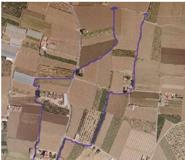
La fotografía aérea de la misma zona del final del brazo de Petra, entre Poble Nou y Carpesa, permite constatar cómo existen grupos de parcelas que conforman bloques entre brazo y brazo de la acequia y/o camino de circulación, y que las subdivisiones internas en hanegadas toman una misma dirección.

Lógicamente todos estos núcleos habían de estar comunicados entre sí y la red principal pero también la secundaria de comunicaciones es fruto de estos siglos, lo mismo que un nuevo proceso de parcelación que no se basó en principio para nada en las centuriaciones romanas. Los parcelarios andalusíes se adaptaron a las curvas de nivel adoptando con ello frecuentes formas irregulares en sus límites exteriores, y al menos en las zonas de la Huerta más alejadas de la ciudad parece deducirse que no llegó a cultivarse ni parcelarse todo el espacio existente entre una y otra alquería.