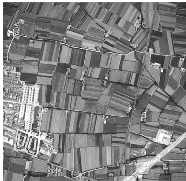
Estructura del parcelario en la huerta de Benimaçlet (1967). Obsérvense los ejes de las acequias y caminos de izquierda a derecha (V-E), irregulares a pesar de lo muy plano del terreno, y cómo las parcelas se ordenan perpendicularmente a ellos. En este caso se trata de medidas en fanecas mayoritariamente y son trazados muy rectos

Estamos hablando pues de una superficie que en su momento máximo de extensión a principios del siglo XX llegó a tener unas 13.200 Ha más otras 4.700 de antiguos marjales, lógicamente hoy reducidas aproximadamente a unos dos tercios de ellas a causa del crecimiento urbano, y repartidas entre 40 municipios. A ello cabe añadir por último la complejidad de su organización social a lo largo