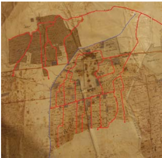
Territorio regado por la acequia de Favara en 1912 en sus dos brazos finales: el de Catarroja y el de Albal. Obsérvese el carácter cerrado de cada bolsa de riego y la forma arborescente de reparto del agua en su interior; así como las zonas de secano en la parte superior del perímetro de riego, junto al cauce de la acequia madre, y lo que también serían secanos o riegos de fortuna o de las fuentes en la parte inferior de cada población.

además por un paleocanal utilizado por el caudal de la Font de la Rambleta, ajeno orgánicamente al sistema hidráulico de Favara.