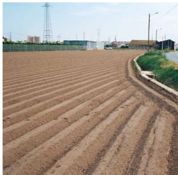
Adaptación de la parcela medida en hanegadas a la curva del camino de Carpesa, generando un límite exterior claramente irregular que dificulta la medición del campo. Razonablemente el camino era previo al repartimiento y medición feudal del siglo XIII y fue respetado como eje organizativo del paisaje

Es por ello que el asentamiento poblacional musulmán alrededor de la ciudad a partir del siglo VIII y su crecimiento progresivo hasta principios del siglo XIII estuvo íntimamente ligado a la construcción de los sucesivos sistemas hidráulicos de la Huerta,